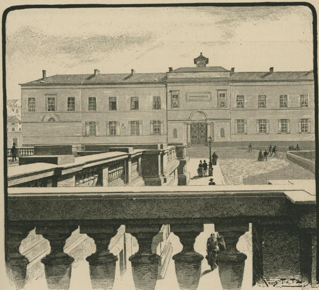
L'HOSPICE PACHÉCO VU DE LA TERRASSE DU PALAIS DE JUSTICE.

Avant de le terminer par le comblement des fossés, la bordure des allées et le pavement de l'allée centrale, l'administration communale eut à examiner divers projets tendant à son aménagement.